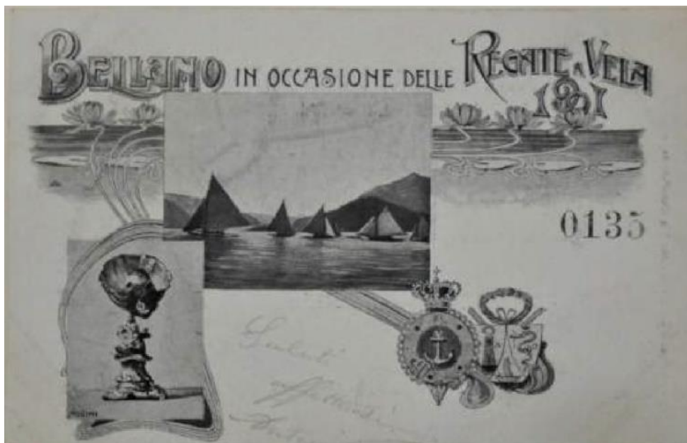
1901 - Cartolina postale commemorativa della prima edizione della Coppa Bellano